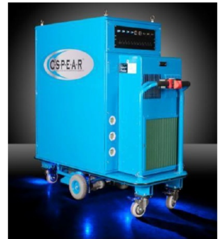
Micro Data Center Móvil