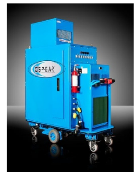
Micro Data Center c/ AC redundante