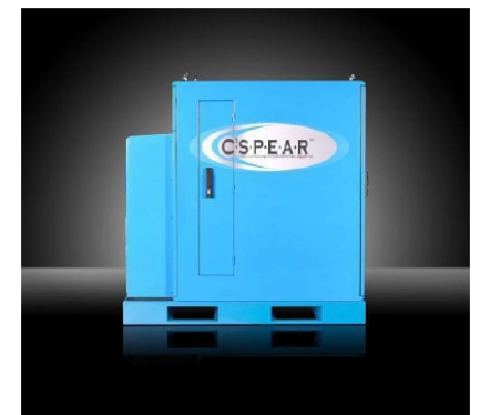
Micro Data Center Relocalizable